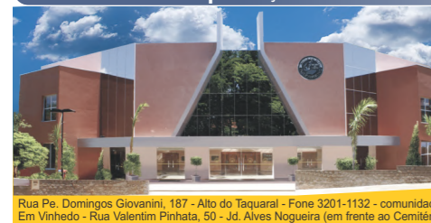
Rua Pe. Domingos Giovannini, 187 - Alto do Taquaral - Fone 3201-1132 - comunidade@nazareno.com.br Em Vinhedo - Rua Valentim Pinhata, 50 - Jd. Alves Nogueira (em frente ao Cemitério) 9669-8300